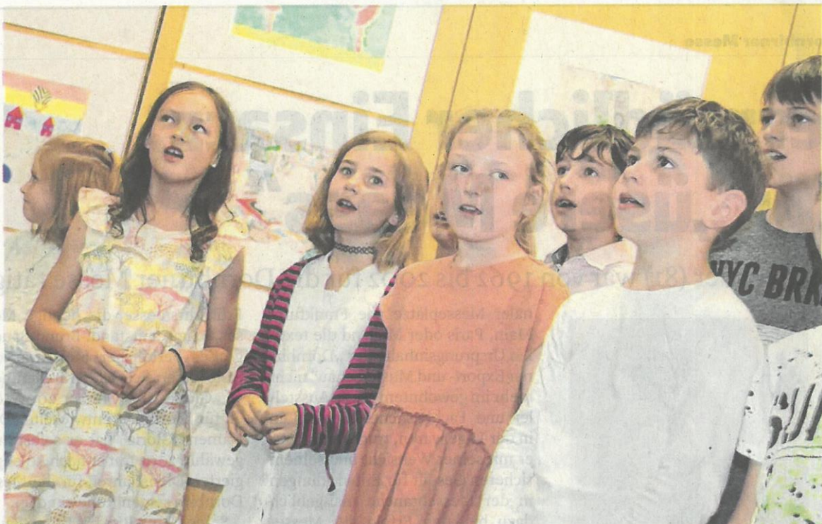
Der Volksschulchor Egg umrahmte die Ausstellungseröffnung.